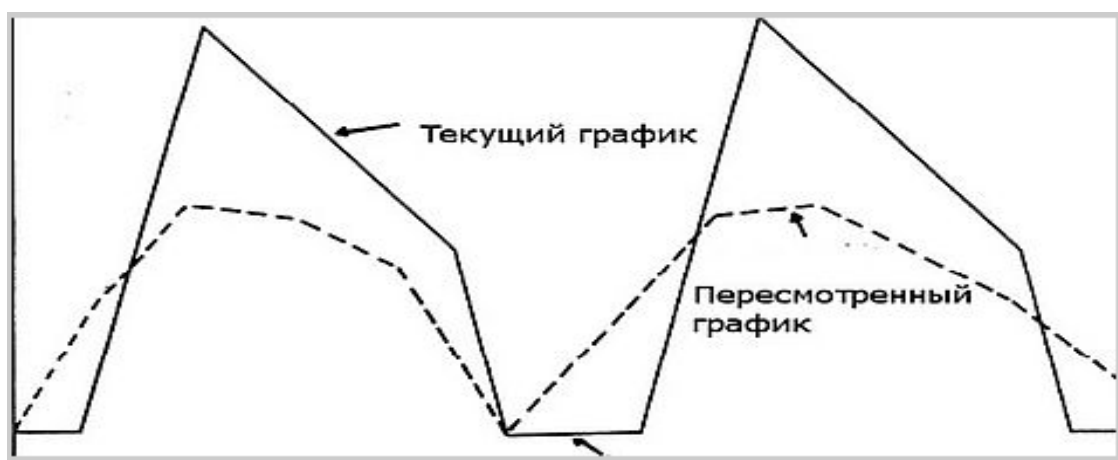
Рисунок – Динамика изменения запасов: текущий и пересмотренный

Задача 1. Перед предприятием стоит задача обеспечения безопасного страхового запаса после внедрения системы MRP. На рисунке представлены графики изменения запасов: текущий и пересмотренный.