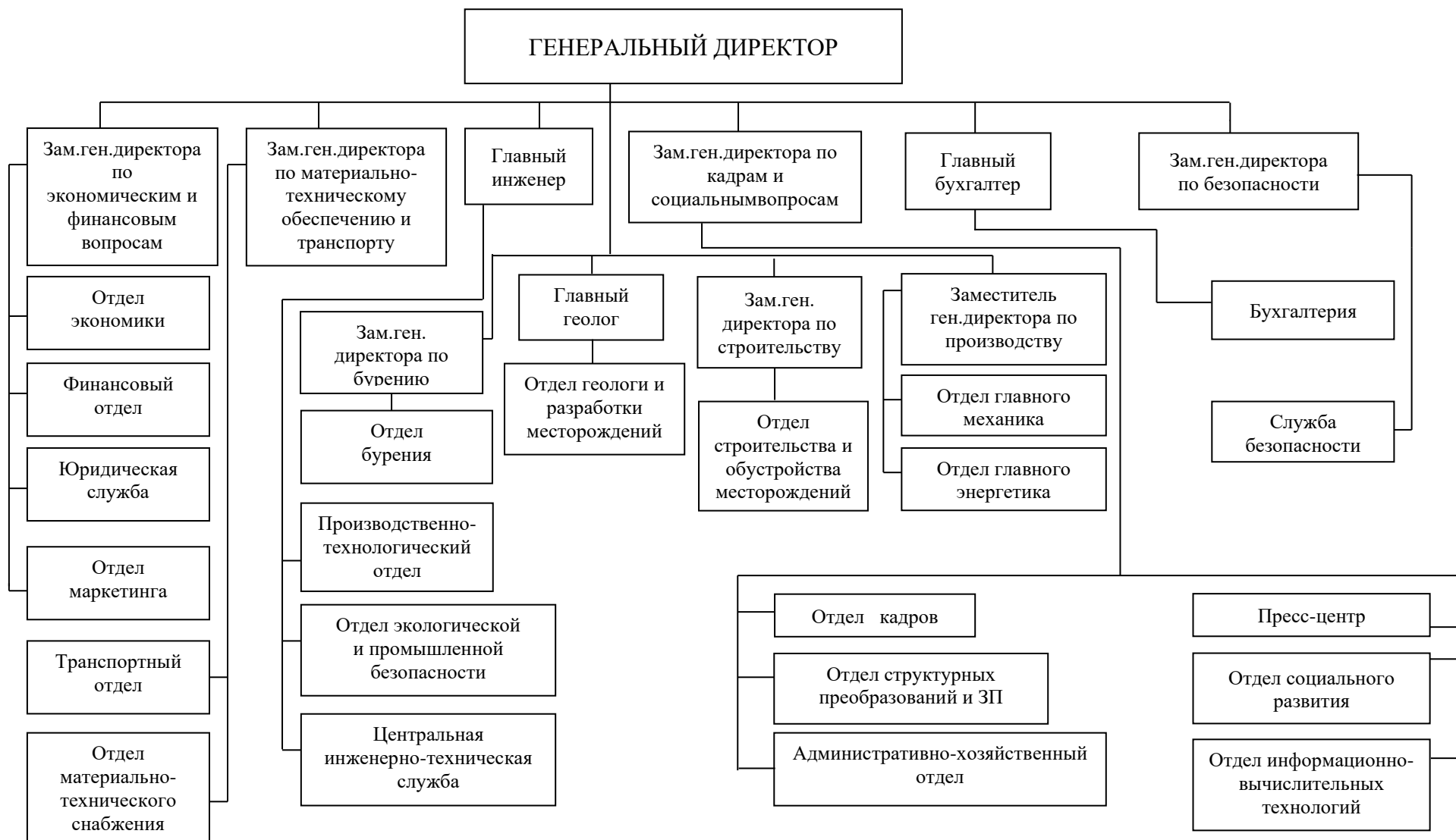
Рисунок 2.1 – Организационно-управленческая структура ОАО «Грознефтегаз»