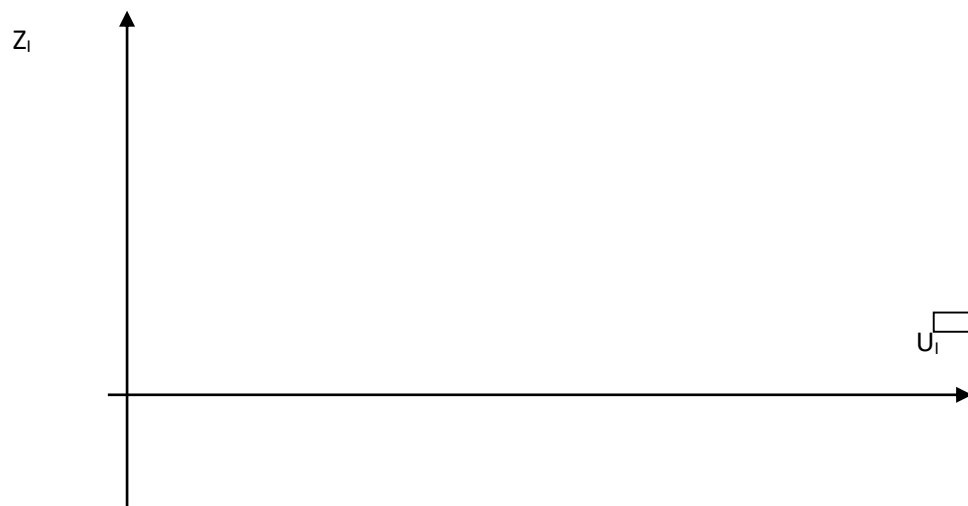
Рис.1 График зависимости z_i(u_i)

Построить график зависимости z_i(u_i) (рис.1), и при нормальном распределении найденные точки должны расположиться вдоль одной прямой линии с небольшим разбросом.