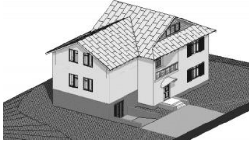
Рисунок 1. Общий вид двухэтажного коттеджа