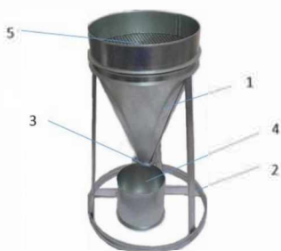
Рис. 1.2. Прибор для определения насыпной плотности материалов: 1 — воронка; 2 — подставка; 3 — задвижка; 4 — мерный цилиндр; 5 — сито

Насыпная плотность сыпучих материалов – масса единицы объема рыхлого сыпучего материала вместе с пустотами. Насыпную плотность определяют при помощи стандартной воронки (рис. 1.2), с поворачивающимся затвором в нижней части, и мерного металлического сосуда объемом 1000 \text{ см}^3 .